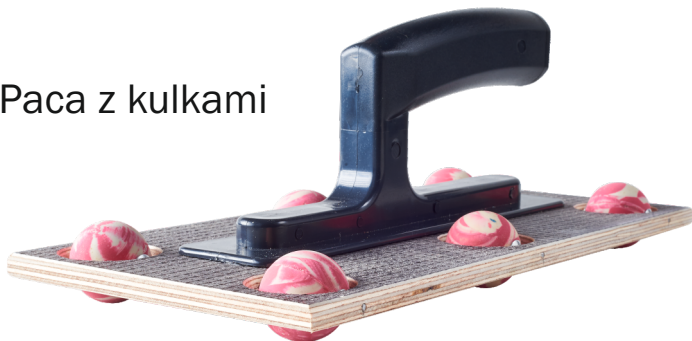
Paca z kulkami